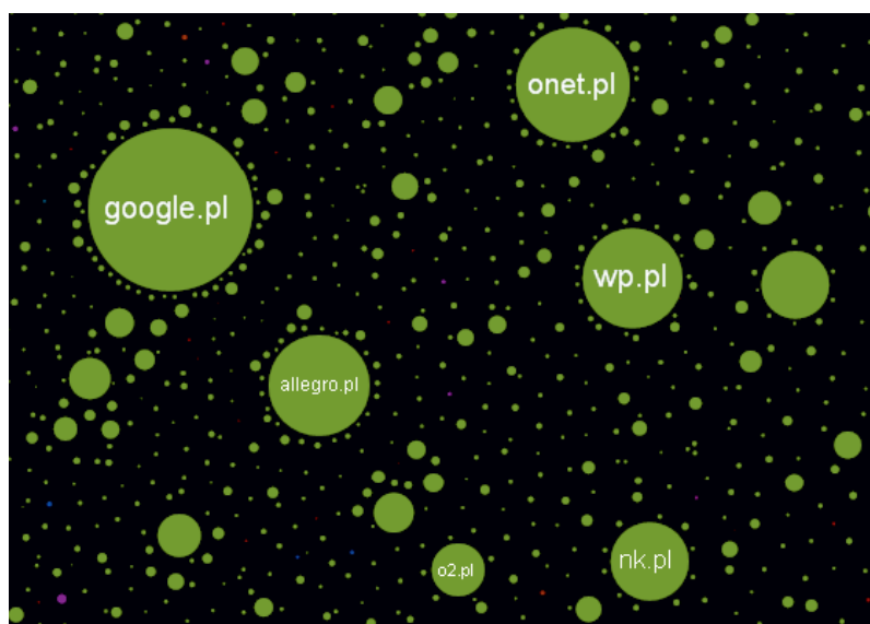
Ryc. 2. Najpopularniejsze witryny internetowe w Polsce według Mapy Internetu

regionu oznaczone są jednym kolorem). Strony z tego samego kraju lub gromadzące zasoby sformułowane w jednym języku są zwykle umiejscowione blisko siebie. Jest to zgodne z obecnymi tendencjami w rozwoju Internetu. Jak zauważa Kazimierz Krzysztofek (2006, s. 26), po okresie fascynacji globalnym zasięgiem komunikacji, coraz więcej ludzi szuka za pośrednictwem Internetu kontaktu z własną lokalnością. Wyrazem tej tendencji jest zmniejszanie się ilości zasobów informacyjnych w języku angielskim, na rzecz innych języków narodowych. Użytkownicy najczęściej poszukują informacji potrzebnych im w codziennym życiu, a zatem pochodzących z ich kręgu kulturowego i sformułowanych w znanym im języku. W polskim Internecie też występują zatem „superwęzły” o lokalnym zasięgu. Są to rodzime portale internetowe, polska wersja wyszukiwarki Google oraz serwis aukcyjny Allegro.